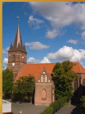
Sankt Nicolai Kirke, Kolding