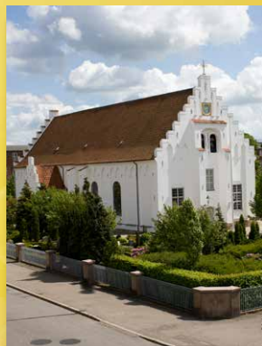
Trinitatis Kirke, Fredericia